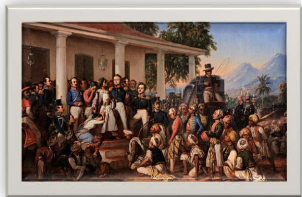
Penangkapan Pangeran Diponegoro

Pangeran Diponegoro adalah seorang pangeran Kesultanan Yogyakarta. Dalam Perang Jawa ia berperan sebagai tokoh utama bersama Kyai Mojo dan Ali Sentot Baharsyah Prawirodirdjo. Mereka tidak setuju atas campur tangan kolonial Hindia Belanda dalam kehidupan kenegaraan istana Kesultanan Yogyakarta. Saat itu kolonial Belanda ikut menentukan penerus kekuasaan Kesultanan Yogyakarta.